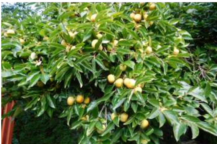
Cây hồng dòn tháng 10-2016 vườn nhà Sương Lam

https://www.youtube.com/watch?v=CJmnVZ_EO4U