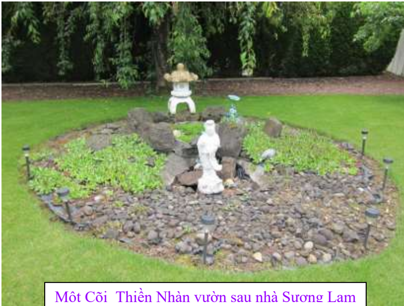
Một Cõi Thiền Nhân vườn sau nhà Sương Lam

Nếu mình để cho những hạt giống không dễ thương, những hạt giống của giận hờn, ganh tỵ, ích kỷ, hơn thua... có cơ hội phát sinh thì mình nhìn đâu cũng thấy “phân bò” hết. Ngược lại, nếu mình biết nuôi dưỡng và phát triển những hạt giống từ, bi, hỷ, xả, những hạt giống thương yêu, cảm thông, tha thứ... thì mình nhìn ai cũng thấy dễ thương, nhìn đâu cũng thấy Tịnh độ, thấy Phật.