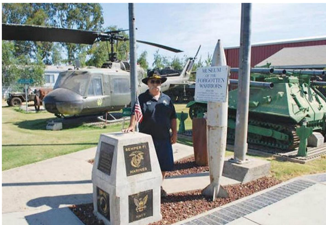
Bảng danh hiệu bảo tàng và Công viên có chiến cụ cũ kéo về từ VN.

- Mới đầu tôi không biết phải làm gì với nó, nhưng rồi nhớ đến anh chị, tôi nghĩ anh chị là những người thích hợp nhất để tôi tặng lại món quà này. Làm ơn thay tôi giữ nó!