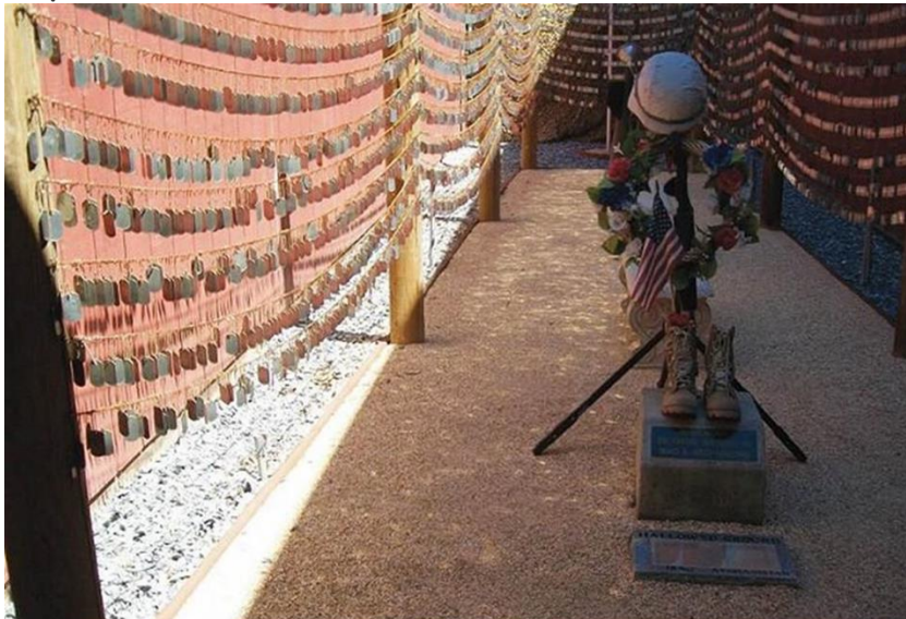
Bên trong khu trưng bày kỷ vật thời chiến.

Tôi cũng rùng mình dựng chân lông. Tấm lòng của ông Dann hình như đã được linh hồn các tử sĩ nhận biết. Có phải họ đã cho thấy hiện tượng này để "vinh danh" ông Dann với chúng tôi chăng? Nhà tôi lật đật đưa máy hình lên bấm một cái. Tuy những ánh sao đó xuất hiện cả trên nền cát của hai bên, nhưng vì vôi vàng ông ấy chỉ chụp được một phía và vẫn thấy rất rõ những ánh sao, phía bên phải hơi bị tối.