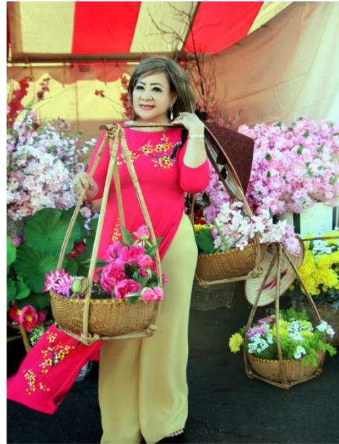
(Phan Lang @ Chợ Tết Phước Lộc Thọ, LA Chúc Xuân Giáp Thìn 2024)

Đưa vai gánh vác giang sơn Dẫn cho khó nhọc không sờn lòng ai Dân giàu, nước mạnh ngày mai Phương Đông hùng cứ, tương lai rạng ngời. (PThuy)