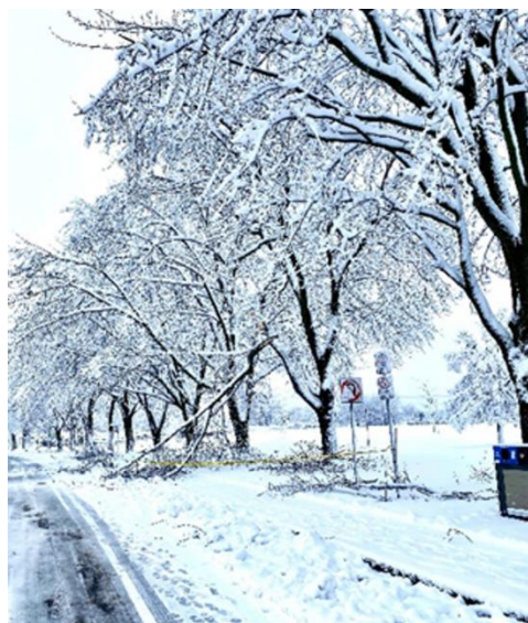
Mùa đông ở Boston

Khi tôi lên 7, tôi đã biết suy đoán. Bố mẹ đã đổi căn nhà lớn hơn và lúc ấy gia đình chúng tôi là một trong những gia đình Mỹ gốc Việt boat people thành công nhất trong tỉnh bang. Để được tiếng thơm và được tiếng tăm lan rộng, bố hay tổ chức những gala, những cuộc parties mời những người giàu có trong thành phố, những người quen biết gần xa mặc dù không có mặt mẹ. Trong số ấy có một cô kéo vĩ cầm rất hay, cô còn trẻ, rất đẹp, thua bố chừng 20 tuổi, cô ngưỡng mộ bố là người thành công trên đất Mỹ đi lên từ hai bàn tay trắng. Cô thích bố, tìm đủ mọi cách để gặp bố thường xuyên. Còn mẹ thì bận trong công việc mở thêm tiệm nail và đầu tư vào nhà đất sinh lời. Bố đã quên mất mẹ và các con, vắng mặt cả những ngày nghỉ bên gia đình.