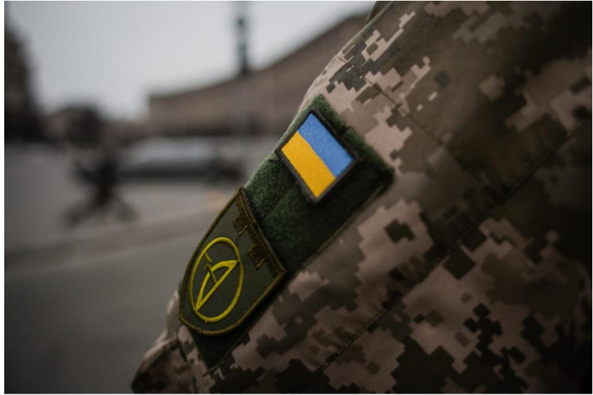
Minh họa: pexels-алесь-усцінаџ

Cuộc chiến này đến bao giờ mới kết thúc? Không ai có thể trả lời được! Trên đầu tôi tiếng máy bay vùn vụt, khói nhà đen cả bầu trời xanh, những hỏa tiễn bắn lên cao tóe sáng rực lửa. Tôi liên tưởng đến những ngày chiến tranh cuối cùng của quê hương tôi cách đây 47 năm. Cuộc chiến ấy đã chia cắt gia đình tôi, đã làm bố mẹ, chị em tôi không còn thấy nhau nữa, như những cánh tay,