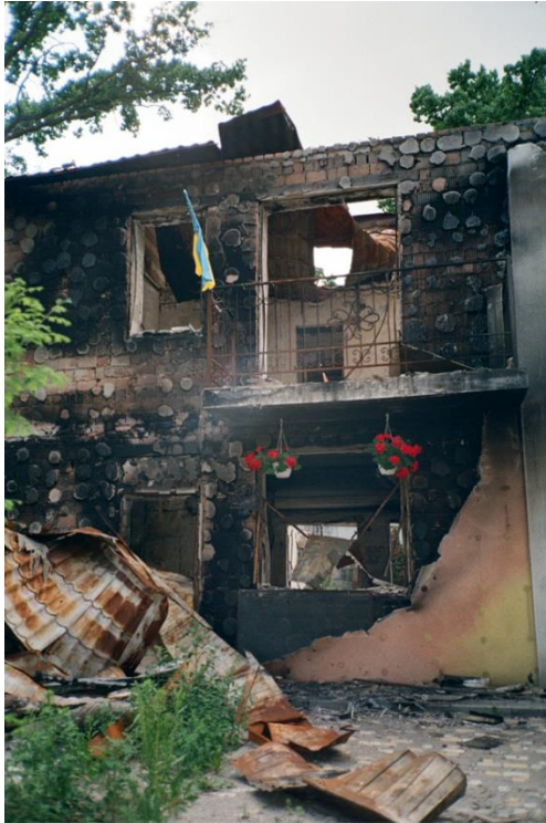
minh hoạ: ksenia-kazak-unsplash

Cháu bé gật đầu và nắm lấy tay mẹ đi như một người lớn biết bảo bọc mẹ, tôi nhìn hình ảnh ấy thật cảm khái tận đáy lòng!