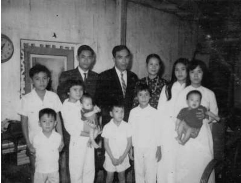
Quảng Ngãi 1970

Mạ lo lắng quan tâm sức khỏe cho cả nhà. Khi bày con còn nhỏ, Mạ vẫn giữ nguyên tắc ăn vừa đủ no, chứ không ăn ráng. Anh chị em trong nhà, hề ai hơi phồng phao một chút, Mạ nhẹ nhàng nhắc nhở.