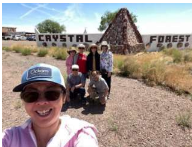
Phía trước cổng Crystal Forest