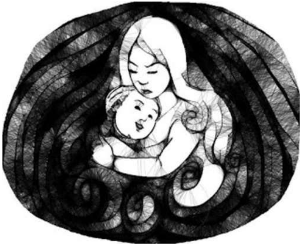
Mẹ Con- Tranh Nguyễn Đức Tuấn Đạt

Lúc chị sanh con đầu lòng, cha mẹ chị còn ở Việt Nam. Mấy anh chị em của chị sống tứ tán khắp nơi trên nước Đức. Đứa bé là cháu nội, ngoại đầu tiên. Bởi thế, hai họ xúm lại nâng niu cháu. Các dì, các cậu, vài tuần đáp xe lửa về thăm cháu. Bên nội ở gần xị, chạy xe 10 phút là đến.