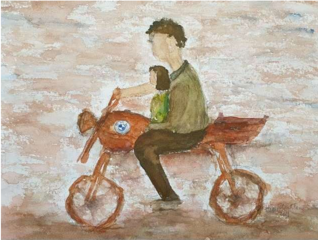
Cha Con - Tranh Hoàng Thanh Tâm

Mới đó, Ba lia đời đã bốn năm. Hai đứa con út của Ba, nay đã “già” hơn Ba thuở Ba đi tù cải tạo năm 1975. Giờ đây, mỗi khi bày con quây quần kể chuyện, nhắc đến Ba thuở xưa, như nhắc một ông cụ, dẫu lúc đó, Ba chưa bước hẳn vào tuổi tri thiên mệnh.