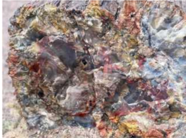
Bề mặt một khúc cây đã hóa đá, rất to và đẹp. Thân cây đã thành đá.

Những gốc cây thật to đã hóa đá đẹp tuyệt vời. Khách thăm viếng khá đông. Cả một vùng núi đồi đá nằm rải rác. Những vân đá nhiều màu sắc rực rỡ. Hiện tượng thiên nhiên lạ lùng và đẹp biết bao nhiêu. Đến đây con người như hòa mình vào với đất trời và khâm phục tạo hóa. Chúng tôi vào cửa hàng lưu niệm và say mê với