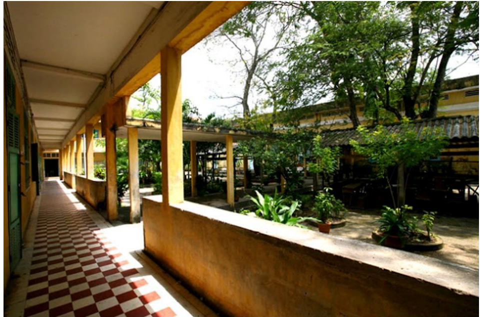
(Nắng Vẫn đi trên những hành lang Tống Phước Hiệp)

Nàng chỉ cầu xin Thượng Đế, cho nàng được giữ lại một chút hương xưa, một tia nắng ấm, một hình ảnh để làm quà cho người đó. Dù món quà không được gửi đi. Ngày nay họ là đôi bạn thân thiết nhất. Nàng vui nhất, hài lòng và toại nguyện nhất, những gì nàng cầu nguyện cho người ấy, trở thành sự thật. Cũng như nàng người ấy có một mái ấm gia đình, một cuộc sống vững vàng, và đầy nghị lực. Thế thì nàng đâu còn gì phiền muộn, ưu tư, khắc khoải. Mỗi người họ đều có một tổ ấm và cuộc đời