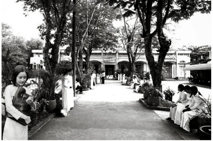
(Tống Phước Hiệp - 1974)

"Tôi muốn tắt nắng đi cho màu đừng nhạt mất Tôi muốn buộc gió lại cho hương đừng bay đi" (Xuân Diệu)