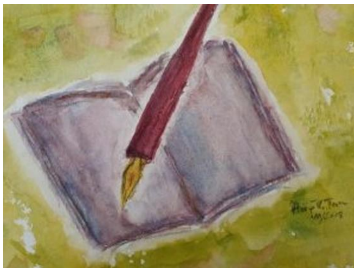
Viết – Tranh Hoàng Thanh Tâm

Tôi yêu tiếng Việt từ thuở bé tí ti. Bập bẹ tập đọc trong lớp mẫu giáo của thầy Thống ở Quảng Ngãi, i u u, o, ô, ơ, a ã â, e ê y Tôi đã cảm thấy những vần, những chữ hấp dẫn hơn nhảy cò cò, chơi ô quan. Thời tiểu học, môn vẽ của tôi được thêm điểm nhờ tôi đặt tên cho “họa phẩm” của mình. Cô giáo bảo vẽ con gà. “Bức tranh” của tôi là một con vật nửa chim, nửa gà với tựa đề “Chú Gà Trống Oai Vệ”. Tập vẽ cây cảnh, tôi chăm chút cả buổi, nguệch ngoạc hai cây dừa, thêm vài nét lãng quăng như sóng, gắn tên “Hàng dừa ven sông”. Những giờ tập làm văn, những bài học thuộc lòng luôn là niềm vui cho con bé học trò tiểu học.