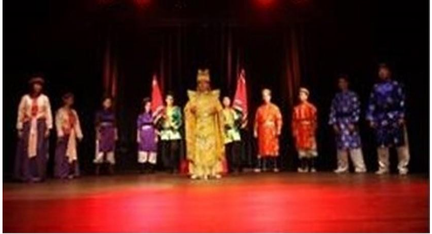
Munich- Đức Quốc 2011