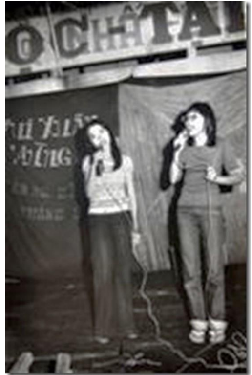
Hóc Môn- Việt Nam 1981