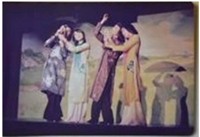
Heilbronn- Đức Quốc 1982

Khi Bê, con trai tôi, bắt đầu học nói, tôi dạy Bê hát nhiều bài hát nhi đồng. Hai mẹ con hát với nhau: Hai chú gà con, Một đàn vịt, Hai con thằn lằn, Con chuồn chuồn, Con chim non... Bê thuộc cả