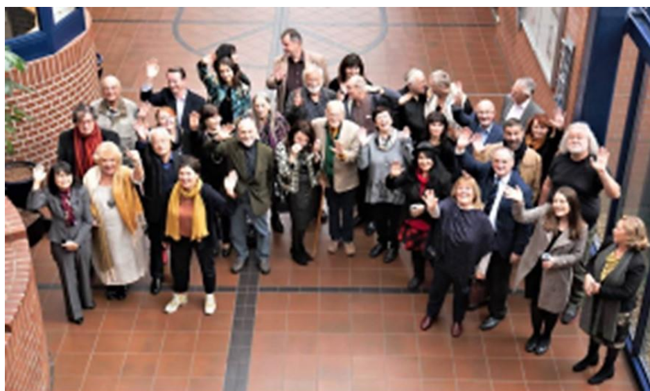
Exil-PEN Sektion deutschsprachige Länder – Frankfurt 10.2018