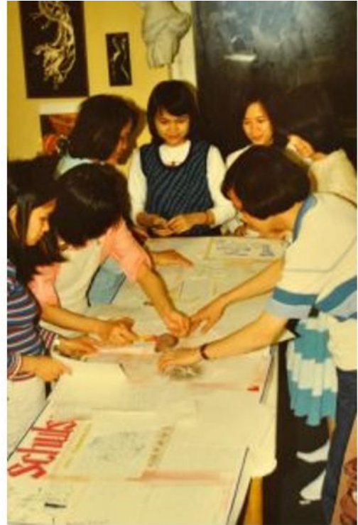
Làm báo der Schulspiegel, 1983

Tháng Mười năm 2018, tôi trở thành hội viên của Văn Bút Lưu Vong Đức Thoại. Ban tổ chức đề nghị tôi đóng góp mục đọc truyện trong kỳ họp thường niên năm sau. Lúc đó, tôi quá chủ quan, nghĩ thầm,