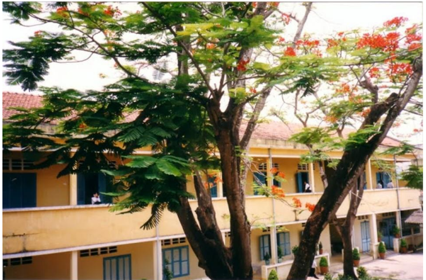
(Tống Phước Hiệp - 2020)

Vào lớp học của ngày nào ngồi lại nơi chỗ cũ, đôi tay vuốt ve chiếc bàn. Cảm giác nhẹ nhàng không sao tả hết. Sao mà thân thương quá! Sao mà êm đềm quá! Và cũng buồn da diết quá! Còn ai đâu chỉ một mình đối diện với bảng đen.