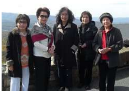
Shenandoah National Park:

Gần đến Skyline thấy có khách sạn, cây xăng, tiệm giải khát, tiệm ăn, nhà thuốc, shopping mall, Big Kmart, Steakhouse, tiệm bán trái cây, mật ong và các thổ sản địa phương.