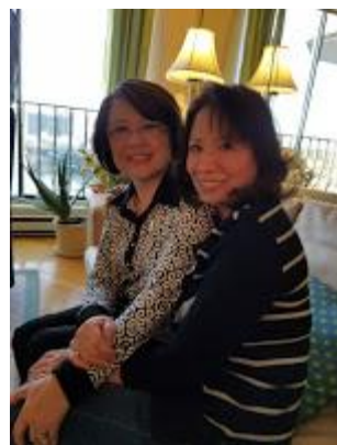
Nhà văn TT&HN

đưa một đồng tiền vàng làm... “của hồi môn” bằng ba đồng Gia Nã Đại.