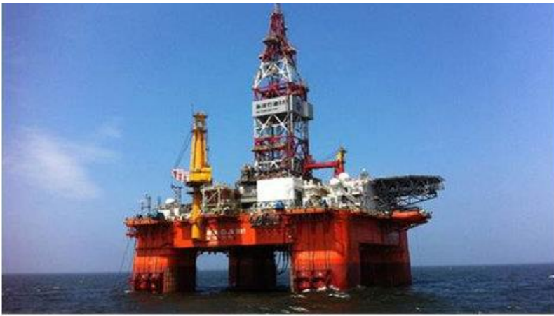
Giàn khoan HD981 của Trung Quốc đang ngang nhiên xâm phạm chủ quyền biển đảo Việt Nam.

Rửa nhục nước bằng máu anh hùng Lạc Việt