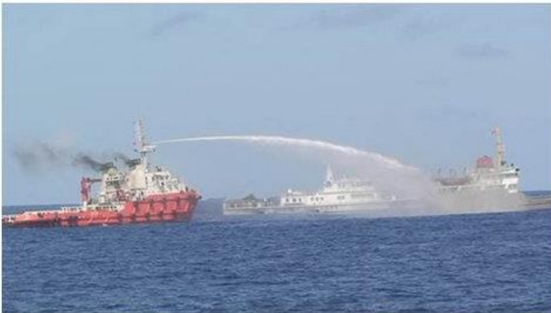
Tàu Trung Cộng phun nước tấn công vào tàu Kiểm Ngư và Cảnh sát biển Việt Nam.