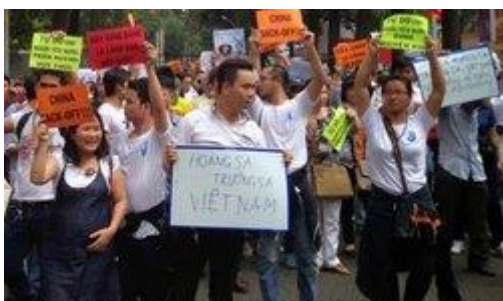
Người phụ nữ mặc áo màu xanh dương đang mang thai mà vẫn đi biểu tình.

Tôi đi giữa phố chợ vui Người quen chào hỏi ngậm ngùi thân cô Tôi đi giữa phố đông người Chao ôi ! Chỉ nhớ nụ cười người xưa Tôi đi giữa phố nắng-mưa Bàn tay nồng ấm người đưa tôi cầm Tôi đi giữa phố lạnh căm Còn ai âu yếm thì thăm bên tôi Tôi đi giữa phố gọi mời Trong tôi còn vọng những lời người trao