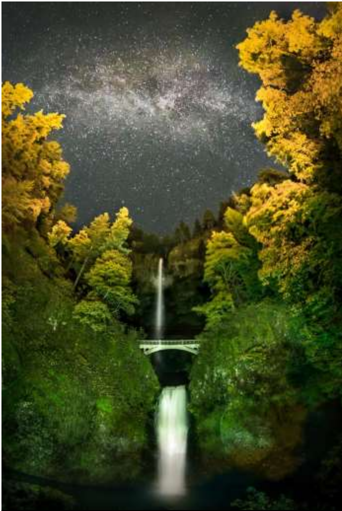
(Multnomah fall in Portland- hình sưu tầm trên net)

Tôi yêu Portland của tôi qua bốn mùa xuân, hạ, thu, đông. Mỗi mùa có một nét đẹp riêng như đã tâm tình ở trên. Khi đã yêu một người nào đó, một nơi nào đó rồi thì trái tim của bạn, của tôi luôn hướng về người đó, nơi đó. Có đúng không bạn? Smile! Tôi yêu Portland, Oregon của tôi như tôi đã yêu Sài Gòn 35 năm trước và cũng muốn những người xung quanh tôi hay thân hữu bốn phương của tôi cũng yêu Portland của tôi luôn. Tôi đã viết cả chục bài tâm tình đăng trong trang nhà Sươnglam Portland của tôi. Tôi thực hiện cả chục youtube về Portland, thành phố, "sương lam mờ đỉnh núi" thơ mộng đăng trên trang Youtube của tôi để bạn bè cùng thưởng ngoạn.