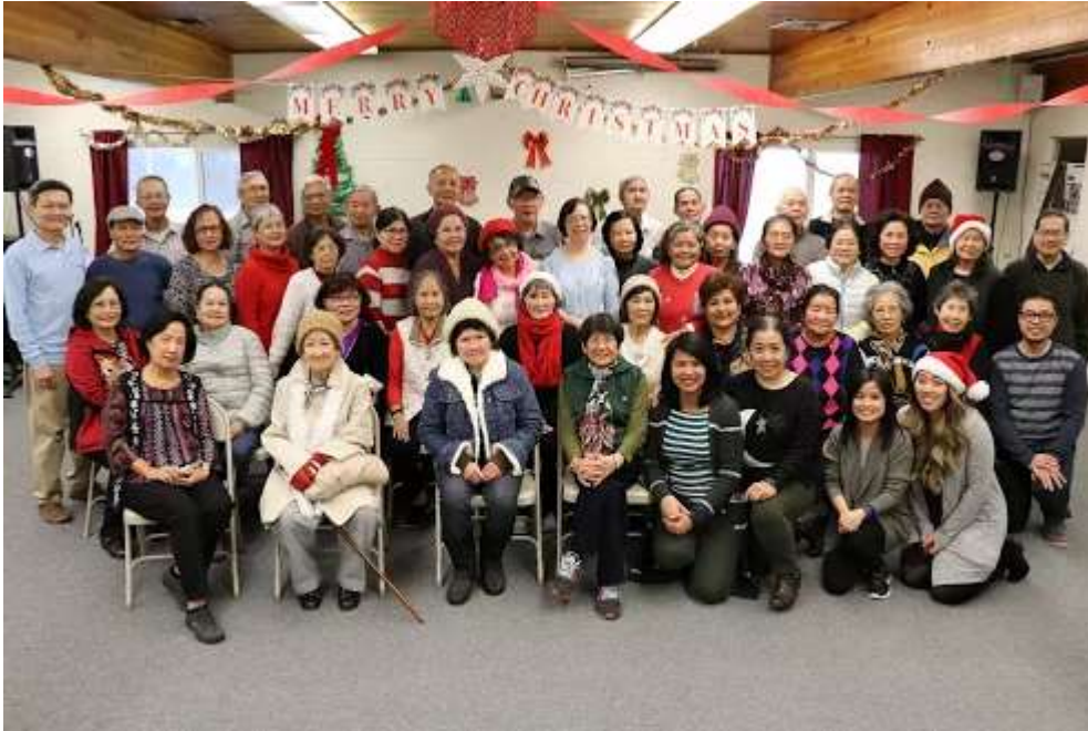
2017 December Vietnamese Senior Group Christmas

Bởi thế, Nhóm Sinh Hoạt Người Việt Portland đã tổ chức một buổi potluck mừng Giáng Sinh vào Ngày Thứ Năm 21 Tháng 12, 2017 tại Trung Tâm Y Tế và Dịch Vụ Châu Á ở 3430 SE Powell Blvd để cho quý vị cao niên Việt Nam chung vui với nhau qua youtube dưới đây do AHSC thực hiện: