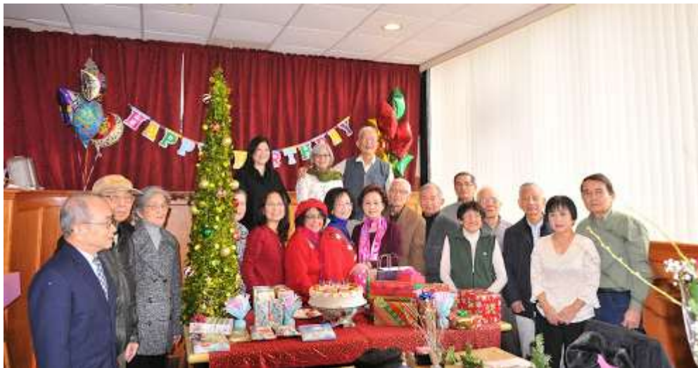
Hình ảnh Mừng Sinh Nhật Hội Viên Tháng 12, Mừng Christmas và New Year 2018

https://photos.google.com/share/AF1QipOODf1e0d7MKD5LxujgVL1RrfrbzKUL94JaoghP5qm8pC51NMP502B412u72WM5Q?key=ajh0bmxnYzFJRTIUbnHLTcwQTN3N1JIMG1QZWVB