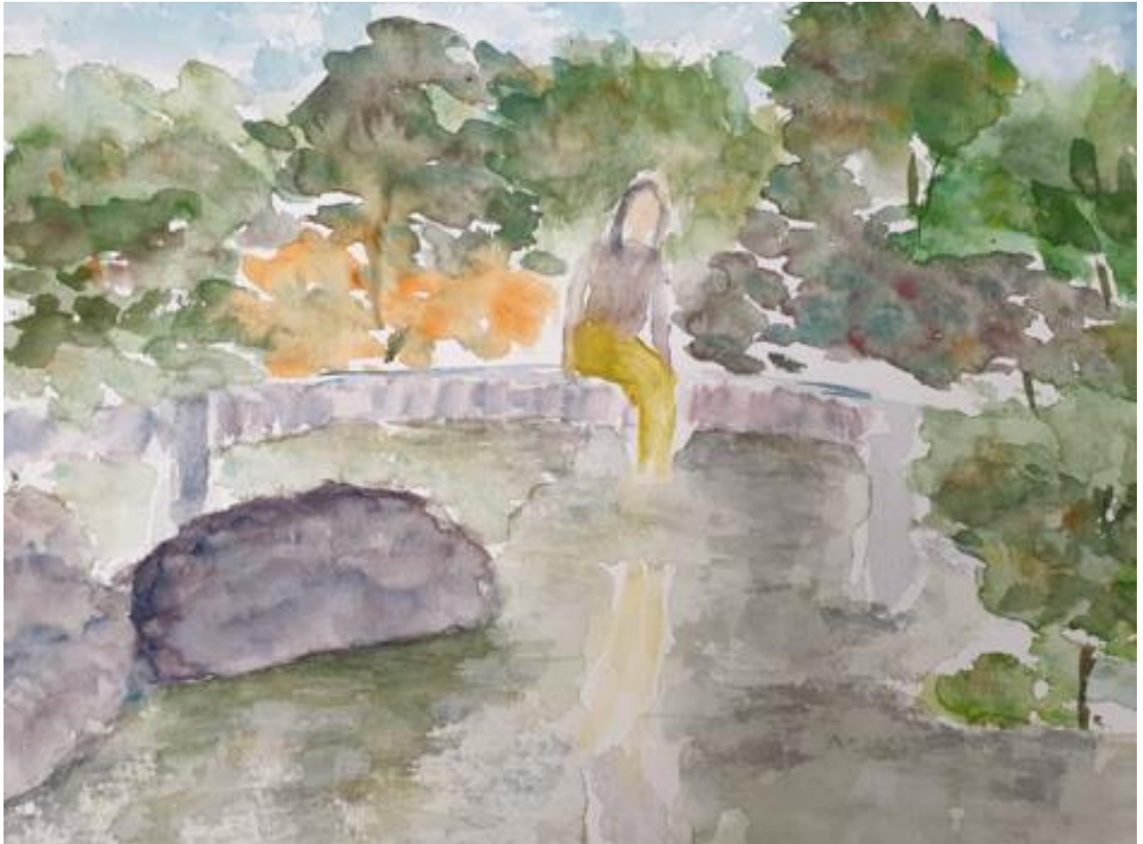
Soi Bóng - Tranh Hoàng Thanh Tâm