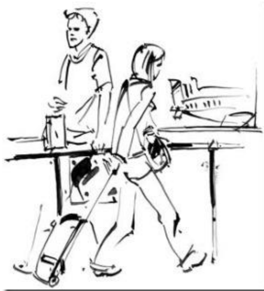
Tranh Minh Họa (Đỗ Tuấn Huy)